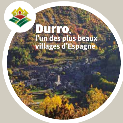
Durro , l'un des plus beaux villages d'Espagne