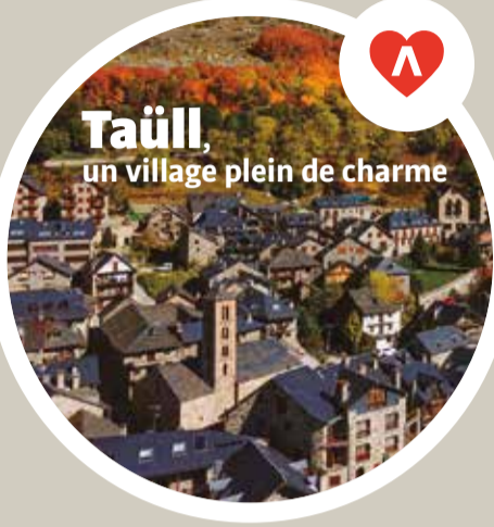
Taüll , un village plein de charme

La Vall de Boí est composée de neuf petits villages, chacun avec son charme unique. Ces villages de montagne présentent des rues pavées, des maisons en pierre, des balcons en bois et des toits en ardoise, des éléments qui s'intègrent parfaitement dans l'environnement naturel.