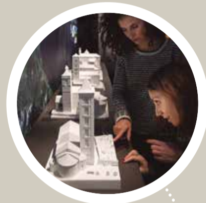
LE CENTRE DU ROMAN D'ERILL LA VALL • Visites guidées • Salle immersive "Les Yeux de l'Histoire" • Salle d'exposition muséale